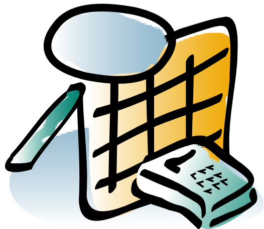
Tableau de bord